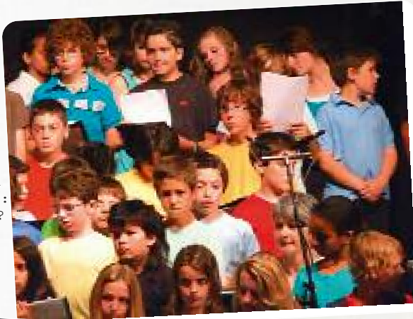
Conte musical au Forum 13 mai 2011 : Qu en sais?tu ?