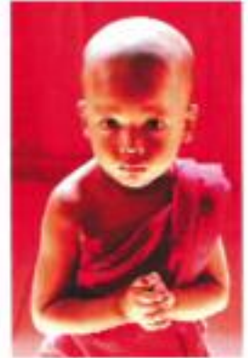
Photographies de Raymond FAU Du 15 au 30 juillet 2011 OFFICE DU TOURISME