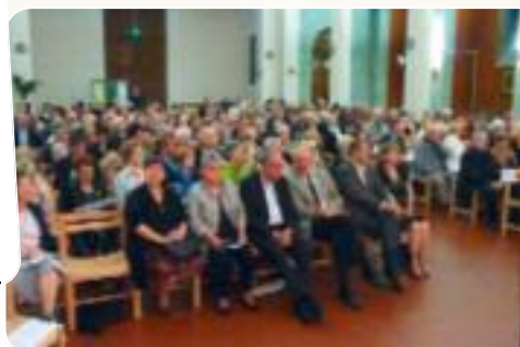
Concert Soroptimist 27 mai : ND du Val d Amour en faveur des patients d Alzheimer