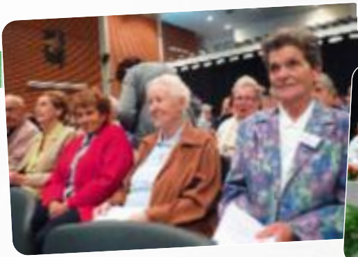
Rencontre d parlementaire 20 mai 2011 Mouvement chr tien des retrait s au Forum de Graulhet avec Mgr Legrez