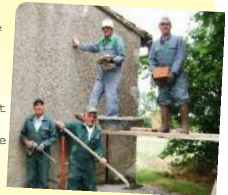
Bénévoles s'attaquant à la restauration de l'église de Larmes.