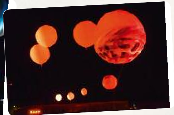
Plasticiens volants au stade P lissou 24 mai 2011 : spectacle BIG BANG